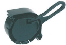
Recommended clamp TELENCO Code 7593